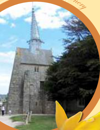
Chapelle St Gonery